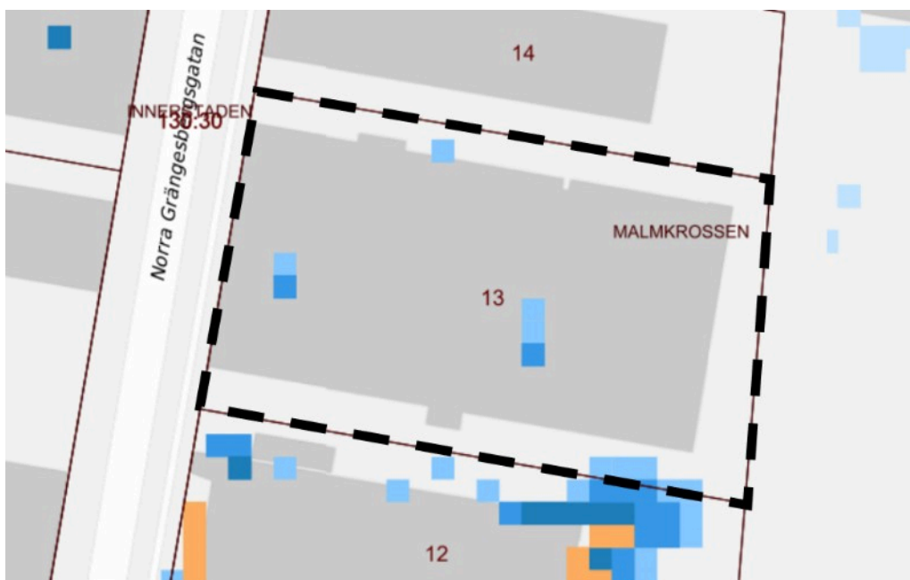
Illustration som visar var vatten ställer sig inom planområdet vid ett 100-årsregn. Planområdet är inom svart streckad linje.

Malmö stad har låtit utföra en kommunövergripande lågpunktskartering. Lågpunktskarteringen är baserad på ett regn med en återkomsttid på 100 år. Karteringen visar att fastigheten inte är särskilt utsatt vid ett skyfallsliknande regn.