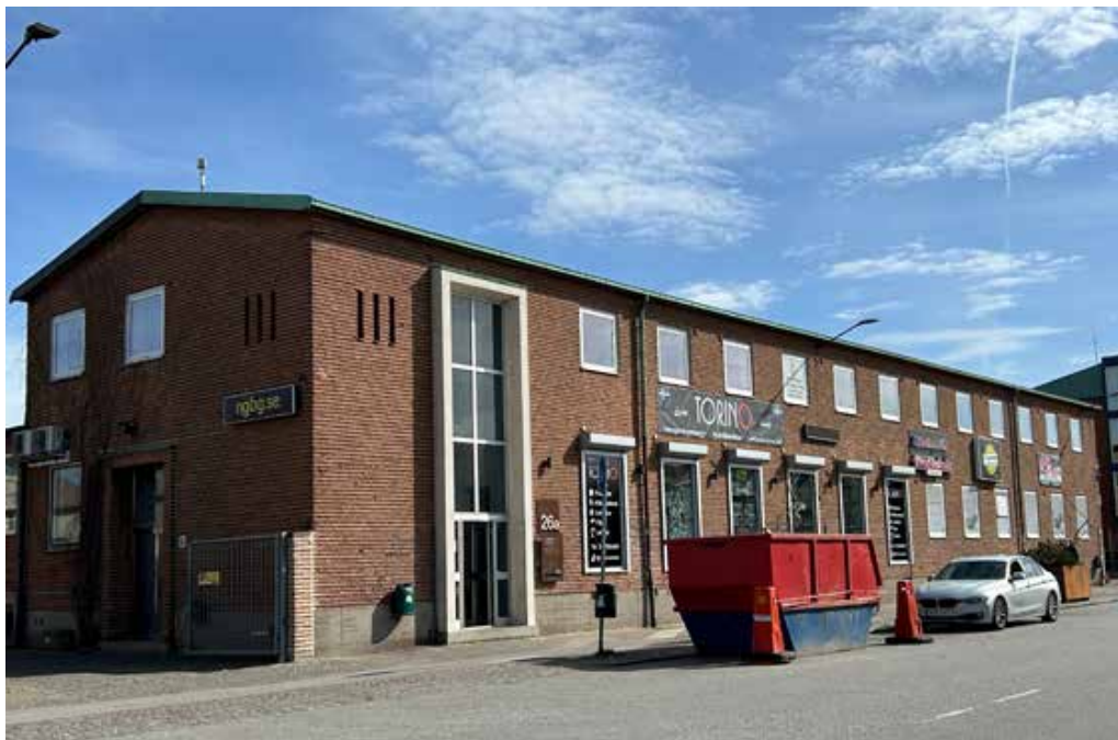
Före detta kontorsbyggnad längs med Norra Grängesbergsgatan.