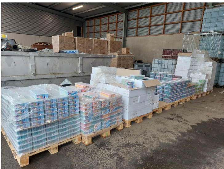
Pallar med godis återfunnet på avfallsstation i Hässleholm.

Inspektörerna i Hässleholm inspekterade godiset och kunde konstatera att vissa förpackningar hade packats om i fyrkantiga tvåkilos plastlådor. Största delen av godiset hade ett passerat bäst före-datum som gick ut 2020, vissa sorter hade enligt märkningen bäst före-datum 2022 och 2023. Godiset verkade även ha delats, från längre godisstänger som packas i avlånga plastlådor till mindre bitar som hade packats om i fyrkantiga plastlådor. Inspektörerna reagerade på att de mindre bitarna hade sneda ”snittytor”.