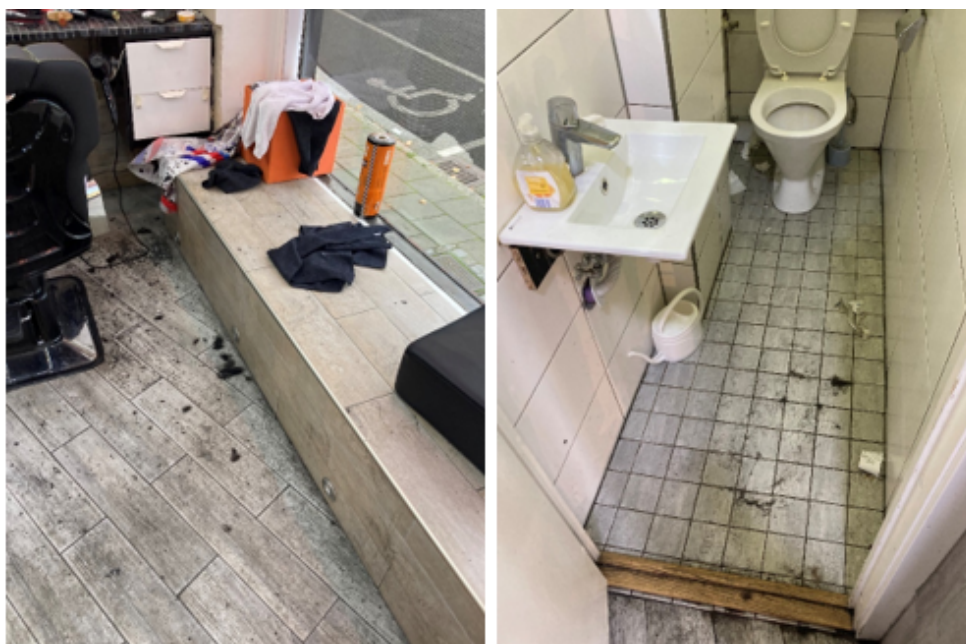
Smutsig behandlingsplats och badrum från tillsynsbesök i verksamhet som stängdes.

Inspektionerna som utfördes under 2022 ledde till åtgärdskrav utifrån hälsoskyddslagstiftningen på samtliga verksamheter, två inspektioner ledde dessutom till tillfälliga stängningar på grund av hygienbrister, vilka senare har kunnat upphävas. Bristerna är i till stor del desamma som inom massagettillsynen, det vill säga dåligt anpassade lokaler, bristande ventilation, dålig hygien samt avsaknad av egenkontroll.