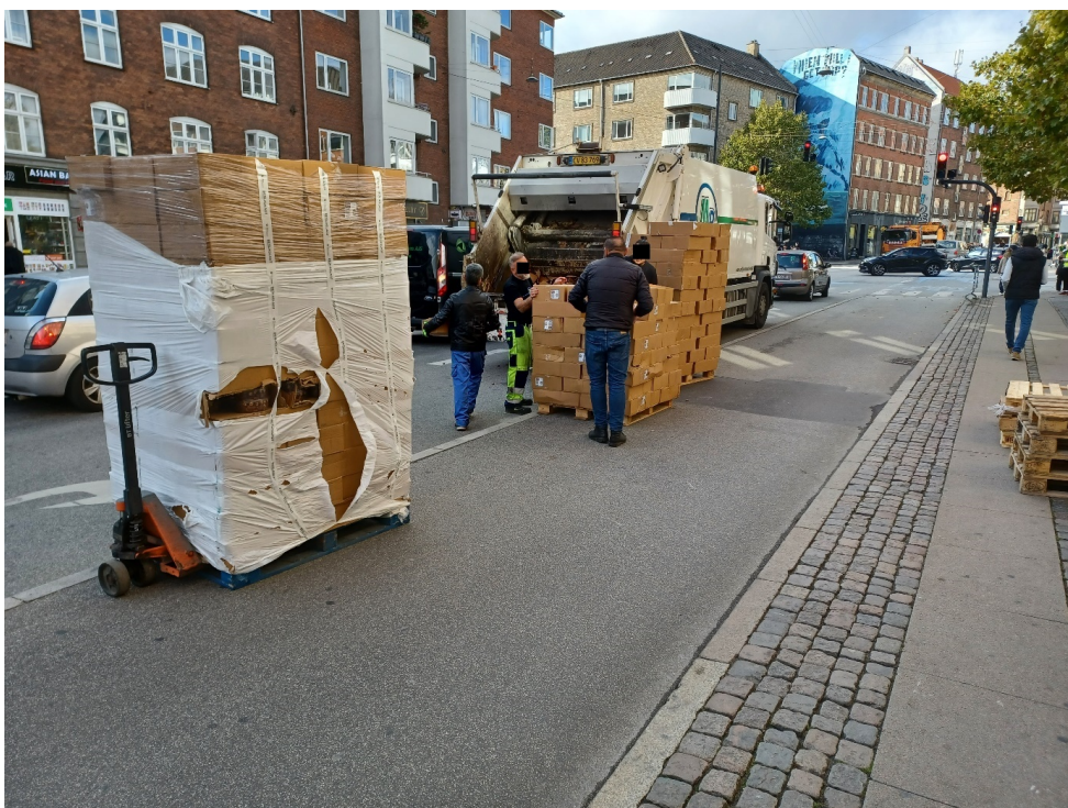
Dadlar destrueras av Fødevarestyrelsen i Danmark.

Livsmedelskontrollen i Danmark beslutade att de 9,3 ton dadlar som förvarades hos grossisten skulle destrueras.