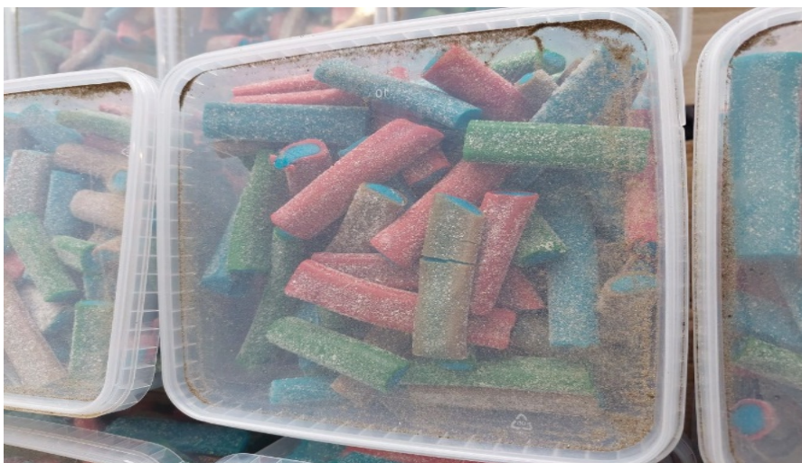
Gammalt godis som delats och packats om.

Inspektörerna i Hässleholm inspekterade godiset och kunde konstatera att vissa förpackningar hade packats om i fyrkantiga tvåkilos plastlådor. Största delen av godiset hade ett passerat bäst före-datum som gick ut 2020, vissa sorter hade enligt märkningen bäst före-datum 2022 och 2023. Godiset verkade även ha delats, från längre godisstänger som packas i avlånga plastlådor till mindre bitar som hade packats om i fyrkantiga plastlådor. Inspektörerna reagerade på att de mindre bitarna hade sneda ”snittytor”.