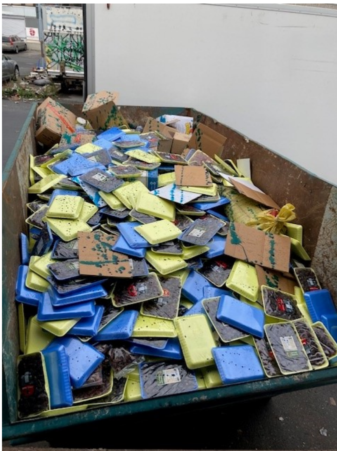
Dadlar destrueras av miljöförvaltningen i Stockholm.

Totalt destruerades 37,5 ton dadlar i Malmö, Danmark och i Stockholm.