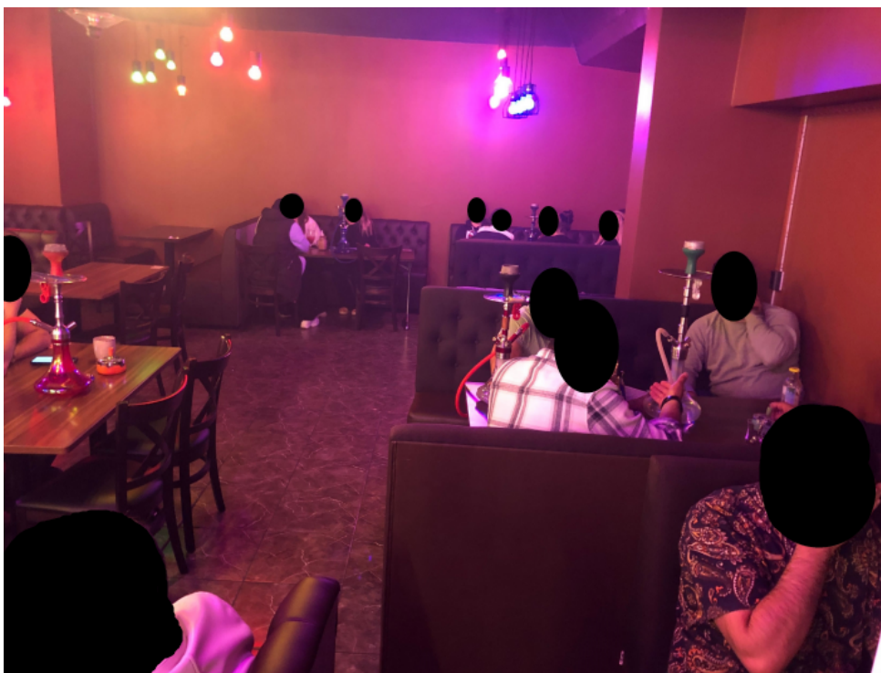
Underhållning och livsmedelsservering i en samlingslokals rökrum.

viktigt för att motverka att det inte dyker upp nya illegala nattklubbar som kan etablera sig.