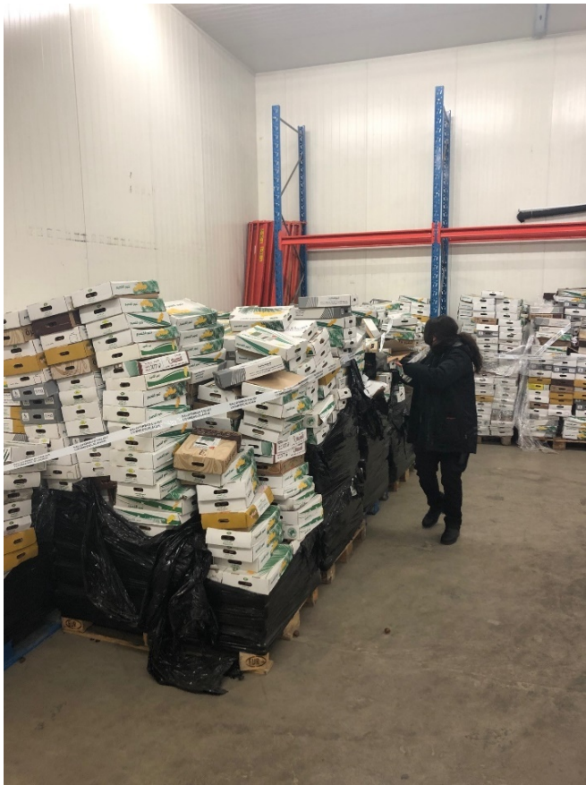
Dadlar tejpas med förbudstejp på ett lager i Malmö.

Miljöförvaltningen fick senare kontakt med företagaren och ett möte bokades. Företagaren förklarade att han hade köpt dadlarna av en släkting i England och att han ville skicka tillbaka dadlarna dit. Detta kunde miljöförvaltningen inte acceptera eftersom bäst före-datumen hade passerats och att han inte kunde visa några relevanta dokument på inköpet.