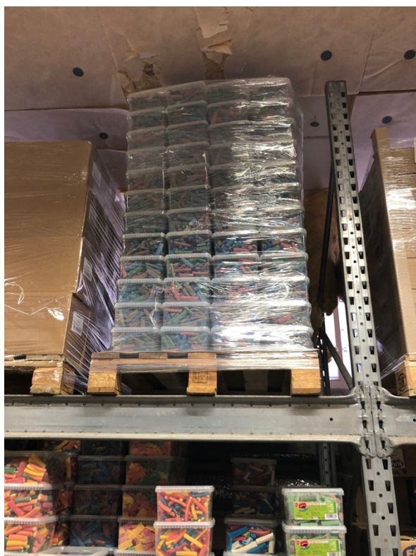
Pall med omärkt godis på ett lager i Malmö

I slutet av augusti genomförde livsmedelskontrollen en kontroll på en av Malmös godisgrossister. Under kontrollen upptäckte livsmedelsinspektörerna två pallar med godis i tvåkilos plastlådor som saknade etiketter och frågade ägaren till grossistföretaget var godiset kom ifrån och fick svar att det var från en godisgrossist i Hässleholm och att de hade stått på lagret i Malmö i cirka ett år och att godiset var spanskstillverkat. På grund av att godiset saknade ingrediensförteckning och hållbarhetsdatum beslutade miljöförvaltningen om saluförbud på godiset, totalt 882 kg, och pallarna tejpades med förbudstejp.