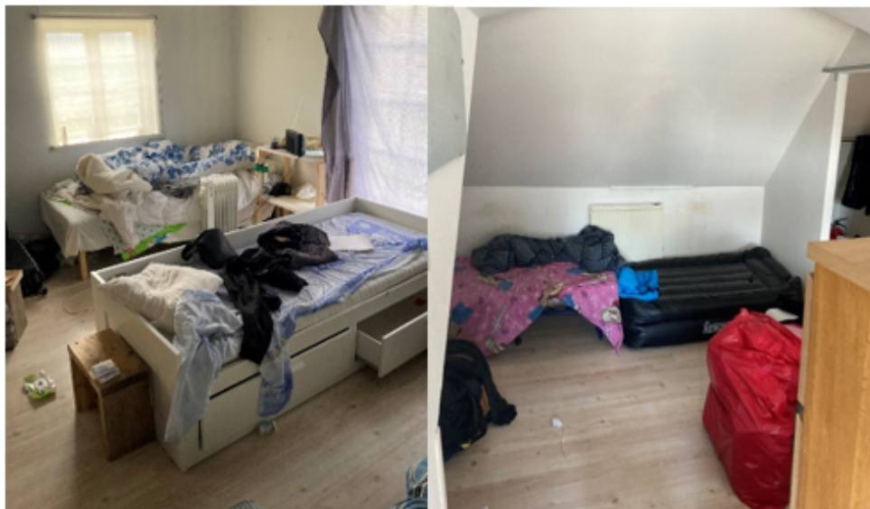
Arbetarnas sovplatser fördelade på två våningsplan.

vidare på miljöförvaltningen för att se om hyreskontrakt fanns, och hur många som kan bo i byggnaden. Ärendet visar på risken med de ”olämpliga bostäderna”, där det finns mindre handlingsutrymme utifrån den gemensamma verktygslådan men tecken på arbetslivskriminalitet och exploatering är kvar. Sett till att gränspoliserna haft ett ärende kopplat till fastigheten och att det vid inspektionen endast var två av åtta arbetare kvar på platsen är sannolikheten stor att de övriga boende utgjordes av arbetare utan arbetstillstånd.