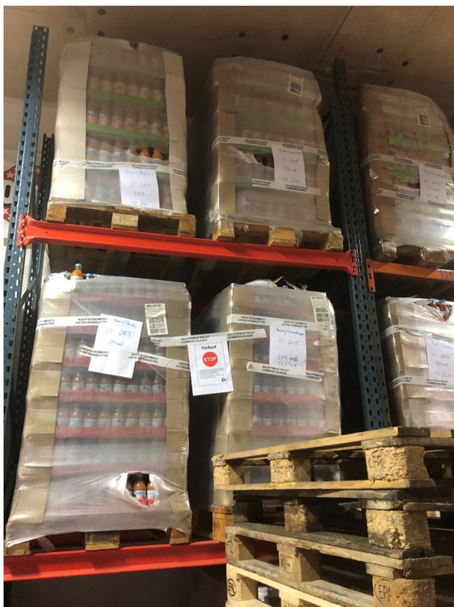
Delar av det stoppade partiet, märkts med förbudsskyltar

Ganska omgående insåg inspektörerna att omfattningen av varor och produktgrupper var så stor att de beslutade sig för att stänga lagret. Ett beslut om tillfällig stängning togs på plats och företagaren fick besked om att inga varor på lagret fick flyttas eller röras. Extra personal från miljöförvaltningen kallades in för att räkna och inventera alla varor. Totalt lades det förbud på cirka 50 ton livsmedel av olika slag, bland annat dadlar, juicer, matoljor och konserver.