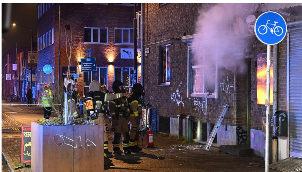
Sydsvenskans bild från branden, (2022-12-11)

Ett annat fall är en fastighet med olovliga boenden på Norra Grängesbergsgatan. Genom Tryggare Malmös uppsökande och samordnade tillsyn upptäcktes och förbjöds bostäder i området under 2019. Under 2022 har fastigheten brunnit vid två tillfällen, i båda fallen har anmälan om mordbrand upprättats. Till följd av Tryggare Malmös uppsökande tillsyn fanns inga bostäder kvar i fastigheten och det är inte osannolikt att det är tack vare detta som inga personskador uppkom vid någon utav bränderna. Bostäderna hade aldrig upptäckts om det inte bedrivits uppsökande fastighetsövergripande tillsyn.