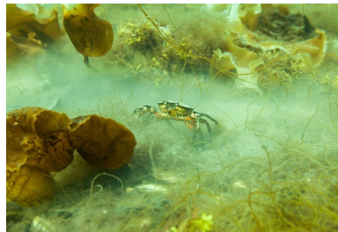
Krabba på botten av Öresund.

Vilda Malmö tipsar om naturområden i Malmö och vad som finns att se och uppleva där. Förutom tips på naturupplevelser anordnas guidningar längs kust och hav, i parker, naturreservat och naturområden och med olika teman som fåglar, fladdermöss, fjärilar och blommor.