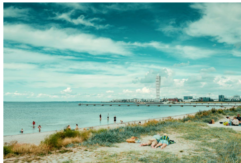
Folk som badar och solar sig vid Ribersborgsstranden med Västra Hamnen i bakgrunden.