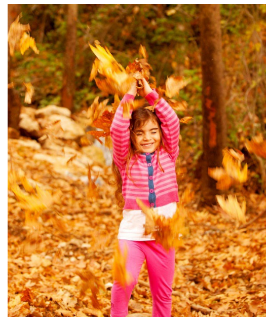
Barn leker med höstlöv.