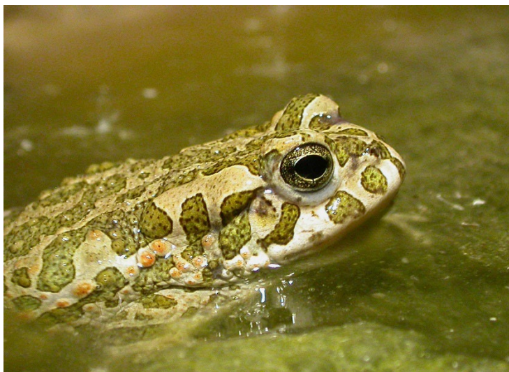
Grönfläckig padda vilar i vattnet.

Rödlistade arter är arter som är hotade av olika anledningar. De olika hotkategorier är Nära hotad (NT) , Sårbar (VU) , Starkt hotad (EN) , Akut hotad (CR) och Nationellt utdöd (RE) . Totalt har över 500 rödlistade arter rapporterats inom Malmö kommun.