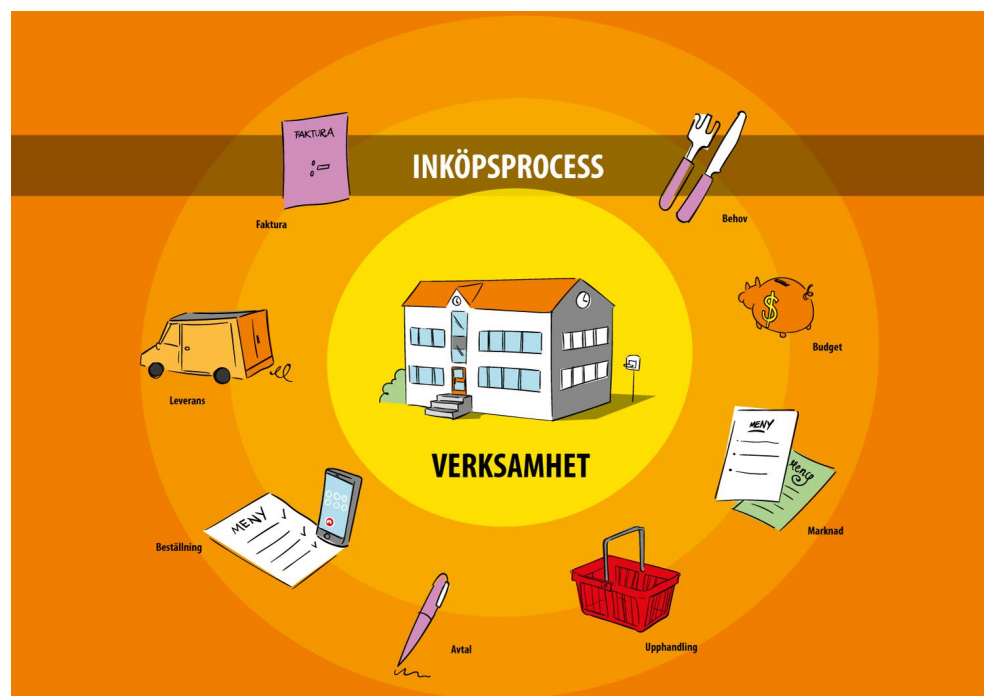
Figur 1: Inköpsprocessen

Med inköpsverksamhet avses, i denna rapport, hela flödet vid anskaffning av varor, tjänster och entreprenader från det att ett inköpsbehov uppstår till det att uppföljning av leverans har skett, ersättning för leverans har reglerats och årsbokslut har upprättats. Detta flöde benämns inköpsprocessen, se figur 1.