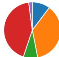
Figur 5: Fråga 21 i enkät till kommunfullmäktigeledamöterna inklusive ersättare januari 2019. I vilken utsträckning anser du att frågor ska skickas till Malmöpanelen? Idag skickas mellan 20-50 frågor per frågeomgång

Även antalet frågor som respondenterna själv föreslagit till Malmöpanelen varierar. Sju svarar att de under sin tid som förtroendevald föreslagit en fråga,