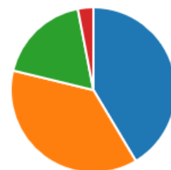
Figur 3: Fråga 13 i enkät till kommunfullmäktigeledamöterna inklusive ersättare januari 2019. Blå - Jag har under min tid som förtroendevald läst ett eller flera medborgarförslag, Orange – Jag har under min tid som förtroendevald diskuterat ett eller flera medborgarförslag vid sammanträde, Grön - Jag har under min tid som förtroendevald varit i kontakt med en initiativtagare av ett medborgarförslag samt Röd - Inget av ovanstående.