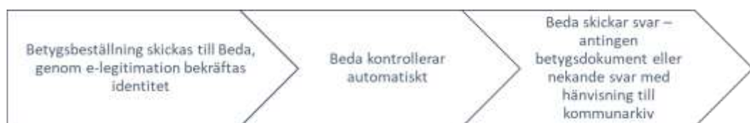
Bild 3 – grafisk beskrivning av tänkt flöde vid e-tjänst för medborgare

Ett föredöme som kan lyftas här är Skatteverkets e-tjänst för att söka fram bouppteckningar. Det enda du behöver göra som beställare är att skriva in din egen e-post och personnummer på den avlidna. Du behöver även godkänna att dina personuppgifter hanteras av Skatteverket under en kortare tid. Efter några minuter kommer e-post från Skatteverket med svar och ifall det påträffats, bifogad bouppteckning. För Beda hade det troligen varit bra att lägga till e-legitimering som del i processen. Detta med tanke på att beställaren behöver godkänna att personnummer för den berörde skickas över digitalt, i enlighet med dataskyddsförordningen.