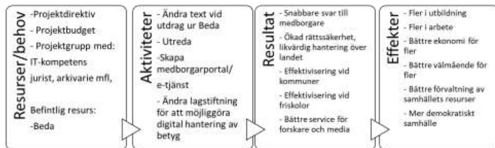
Bild 4, effektkedja

Ett annat sätt att beskriva de praktiska och strategiska fördelarna med förslaget att utöka Beda till en nationell medborgarnära betygsdatabas, är genom en effektkedja.