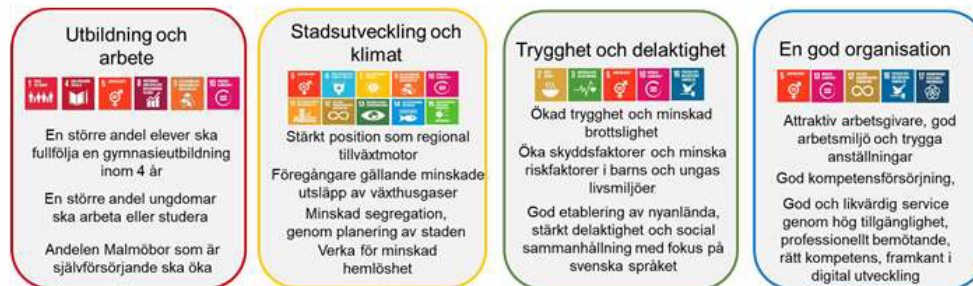
Bild 1. Målområden med kommunfullmäktigemålen

Kommunfullmäktigemålen är uppdelade i fyra olika målområden: