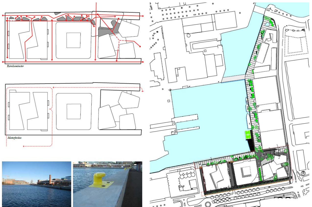
Fig. 2: Utdrag ur "Gestaltningkoncept för Bassängkajen och Neptuniplan – Universitetsholmen Gestaltningkoncept".