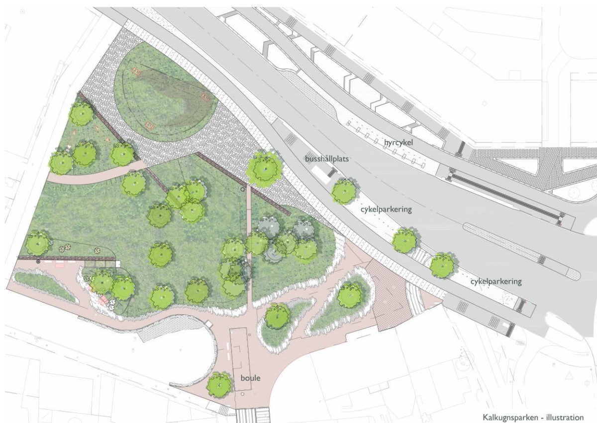
Fig 2. Ombyggnation av Kalkugnsparcken

Kalkugnsparcken, som ligger intill hyrcykelstation och busshållplatser, blir mer attraktiv i sin utformning och utvecklas till en plats för vistelse genom bl.a. anläggande av bouleplan, hängmattor, och solbänkar/soffor. Kalkugnen bevaras, men uppmärksammas och tydliggörs genom ny beläggning kring ugnen. Samråd har hållits med Länsstyrelsen gällande denna lösning. Nytt gångstråk i parken med nya naturstensmurar leder gående förbi fornminnet.