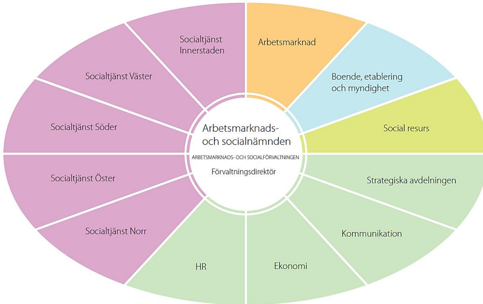
Figur 1 Arbetsmarknads- och socialförvaltningens organisation