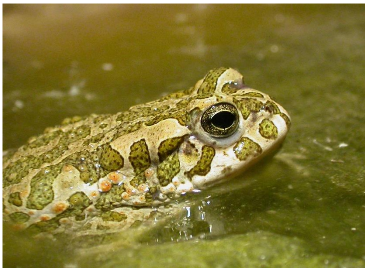
Grönfläckig padda vilar i vattnet.

Rödlistade arter är arter som är hotade av olika anledningar. De olika hotkategorier är Nära hotad (NT) , Sårbar (VU) , Starkt hotad (EN) , Akut hotad (CR) och Nationellt utdöd (RE) . Totalt har över 500 rödlistade arter rapporterats inom Malmö kommun.