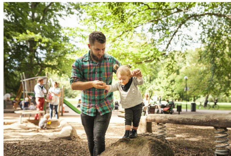
En man leker med ett barn på naturlekplats.

Prognoserna för framtidens väder pekar mot en ökad risk för skyfall. Detta kan leda till översvämningar, utsläpp av föroreningar och erosionsskador. De gröna och blå miljöerna är en viktig resurs för att hantera de utmaningar som ökad nederbörd för med sig. Vatten kan infiltrera i vegetationsytor och tas upp av träd och andra växter, vilket minskar mängden dagvatten och avrinningshastigheten 6 .