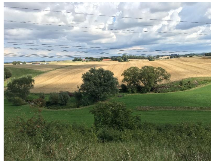
Utsikt över Hasenbjär jordbrukslandskap med åker, träd och vall.