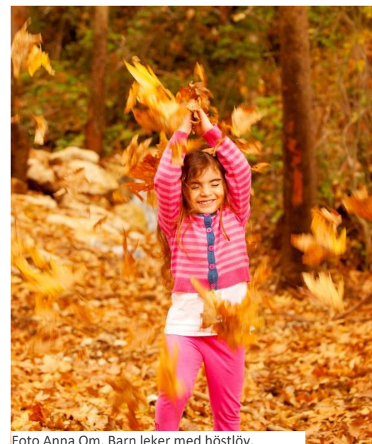
Barn leker med höstlöv.