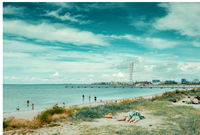
Folk som badar och solar sig vid Ribersborgsstranden med Västra Hamnen i bakgrunden.