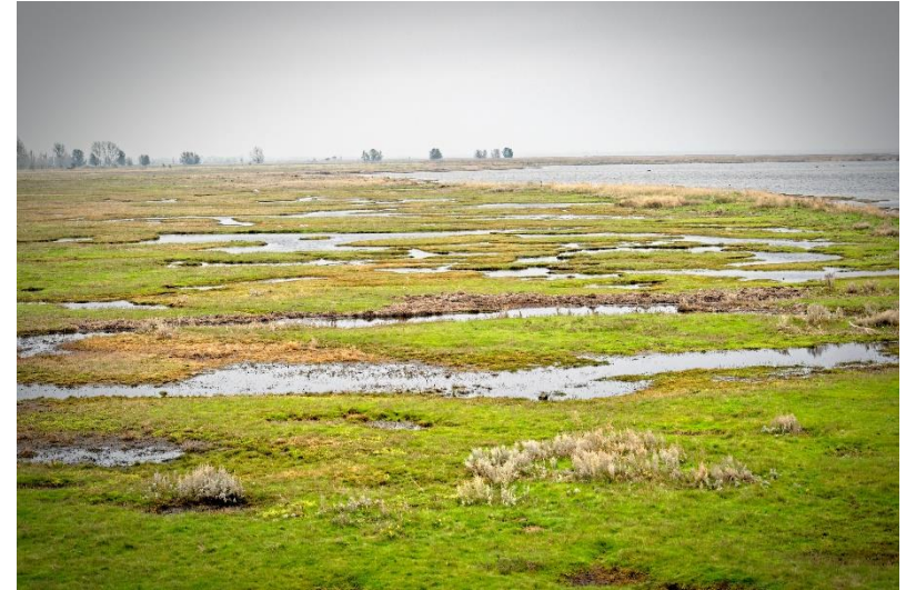
Vy över strandängarna i Fotevikens naturreservat.

Uppföljning av naturvårdsplanen och dess mål sker två gånger. Första gången 2026 vid mandatperioden slut som en halvtidsuppföljning och andra gången 2030 då naturvårdsplanen och även miljöprogrammet går ut. Uppföljningen sker genom att indikatorerna följs upp och en analys görs av i vilken utsträckning målen och naturvårdsplanens ambitioner uppnåtts. Vid uppföljningen 2026 ska förslag på eventuella förändringar föreslås som behövs för att uppnå planens mål. Ansvarig för uppföljning är stadsbyggnadsnämnden och övriga inblandade nämnder bidrar i arbetet.