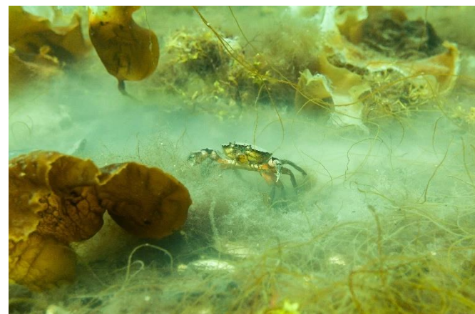
Krabba på botten av Öresund.

Vilda Malmö tipsar om naturområden i Malmö och vad som finns att se och uppleva där. Förutom tips på naturupplevelser anordnas guidningar längs kust och hav, i parker, naturreservat och naturområden och med olika teman som fåglar, fladdermöss, fjärilar och blommor.