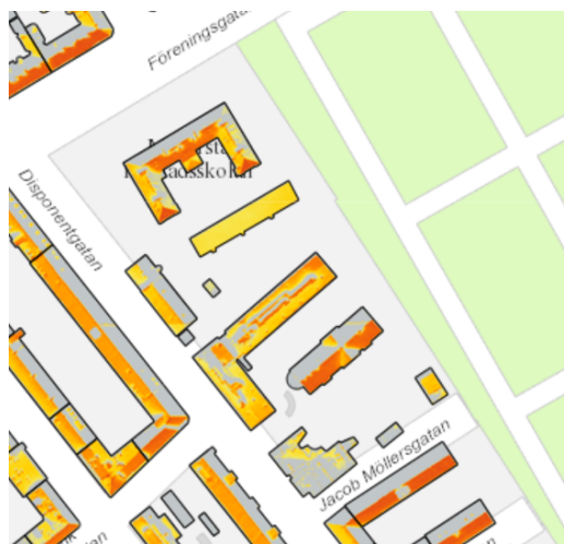
Solkarta för fastigheterna