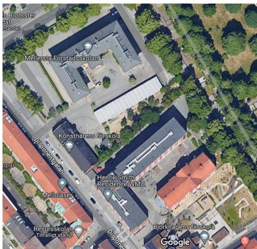
Fastigheten folkskolan 1, 2 och 3.