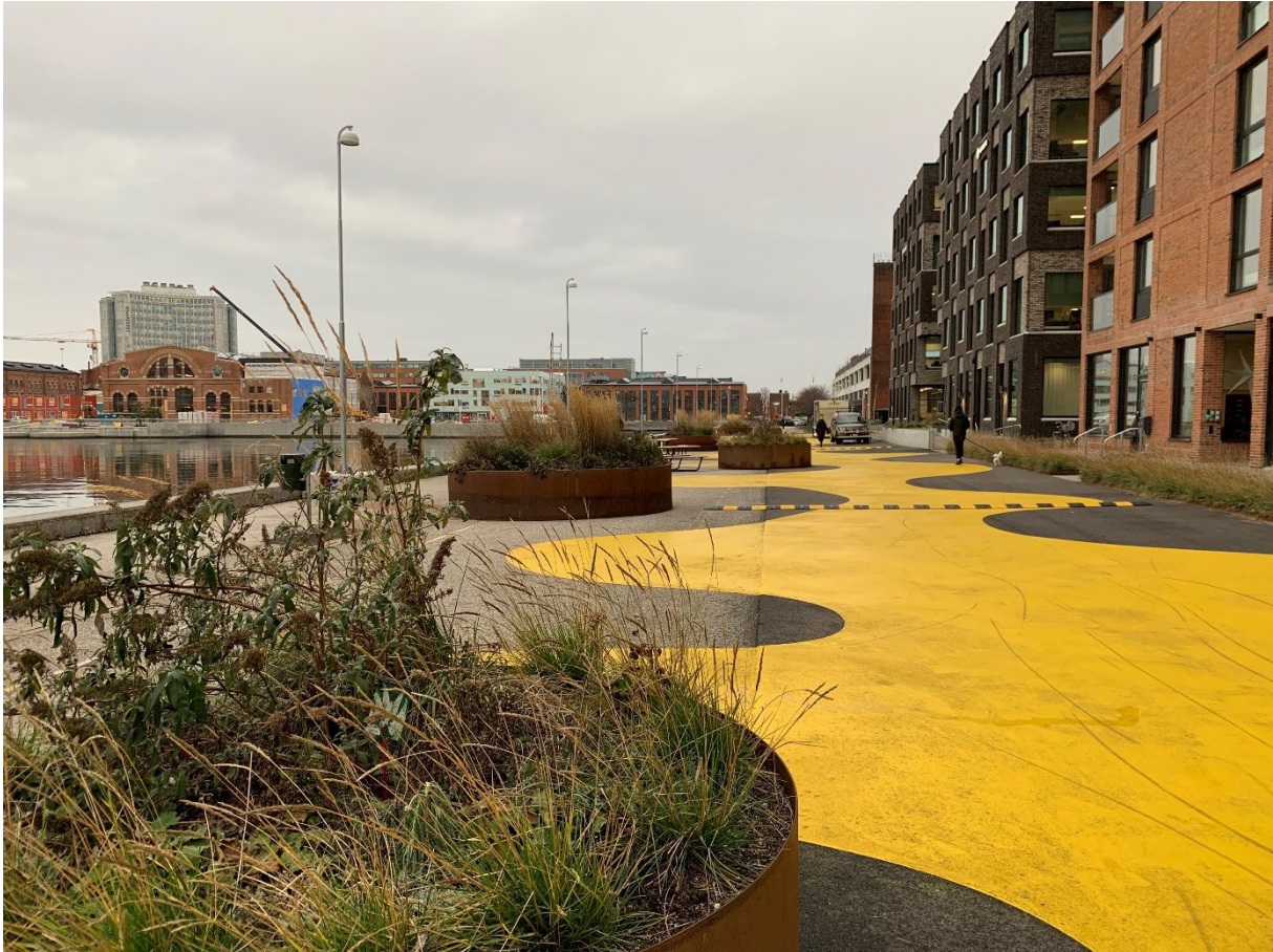
Figur 3: Fotot visar resultatet av de tillfälliga åtgärderna på Beijerskajen

I förhållande till tidigare beräkningar väntas projektet bli dyrare främst på grund av nedanstående orsaker: