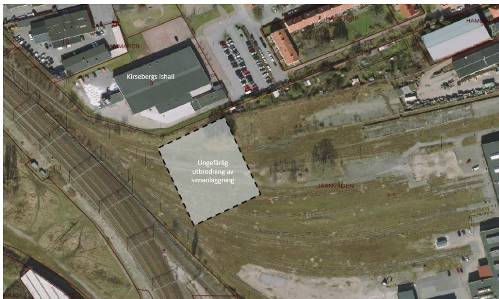
Bild – Detaljerad bild över läge A

blandad stad. Detaljplaneuppdraget är i huvudsak inriktat på att skapa möjligheter för bostadsbebyggelse, park samt kommunal service i form av skola, förskola och sporthall.