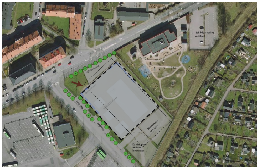
Bild – Detaljerad bild över läge B

Läge B ligger på befintlig grusplan för fotboll i korsningen mellan Södra Bulltoftavägen och Mölledalsgatan öster om Järnvägsverkstäderna och Nobinas bussdepå. I anslutning till grusplanen ligger Bulltofta förskola och Östra Sommarstadens koloniområde. Marken ägs av Malmö stad.