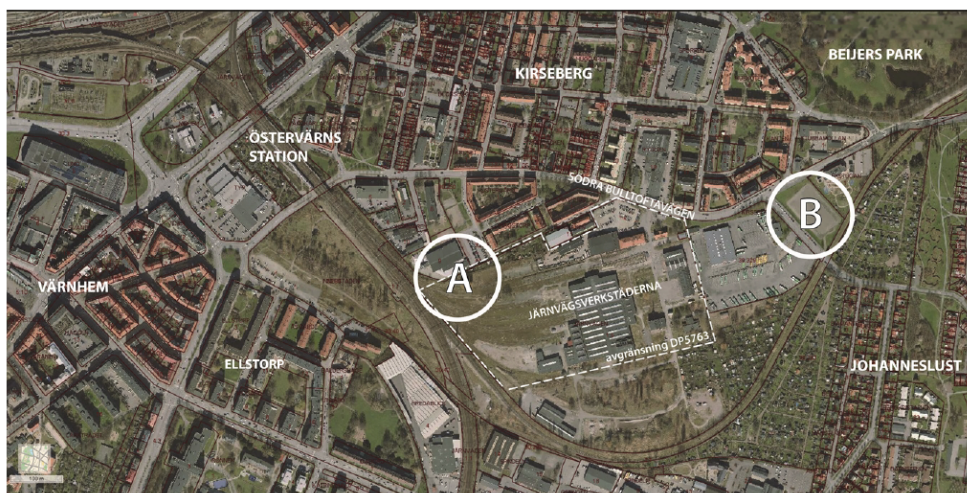
Bild – Lokaliseringsförslag A och B i södra Kirseberg

Båda lokaliseringsförslagen ligger i anslutning till Järnvägsverkstäderna i södra delen av Kirseberg, vilket illustreras i bilden nedan.