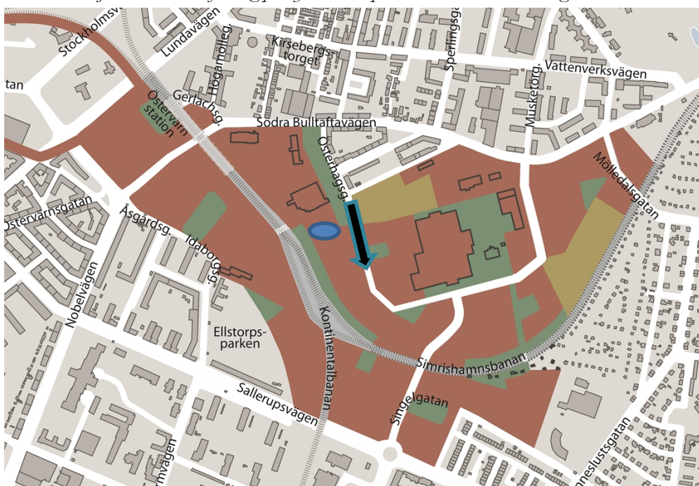
Bild – Detaljerad bild över förslag på ny strukturplan i området och huvudgator.

Vid läge B har bussarna möjlighet att angöra från Mölledalsvägen vilken ansluter till större vägar i väster (bland annat Nobelvägen och Stockholmsvägen) och i öster till Inre Ringvägen.