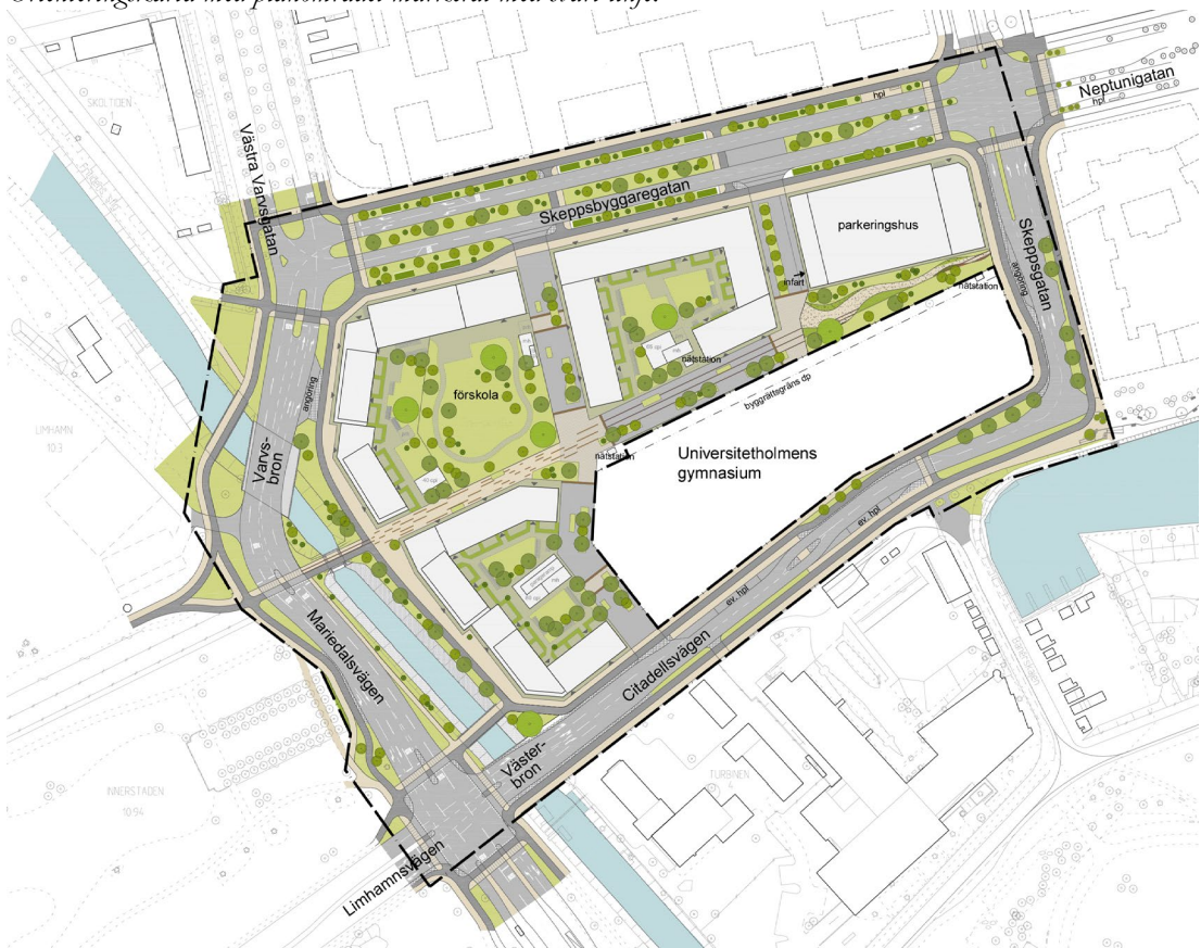
Illustrationsplan för området