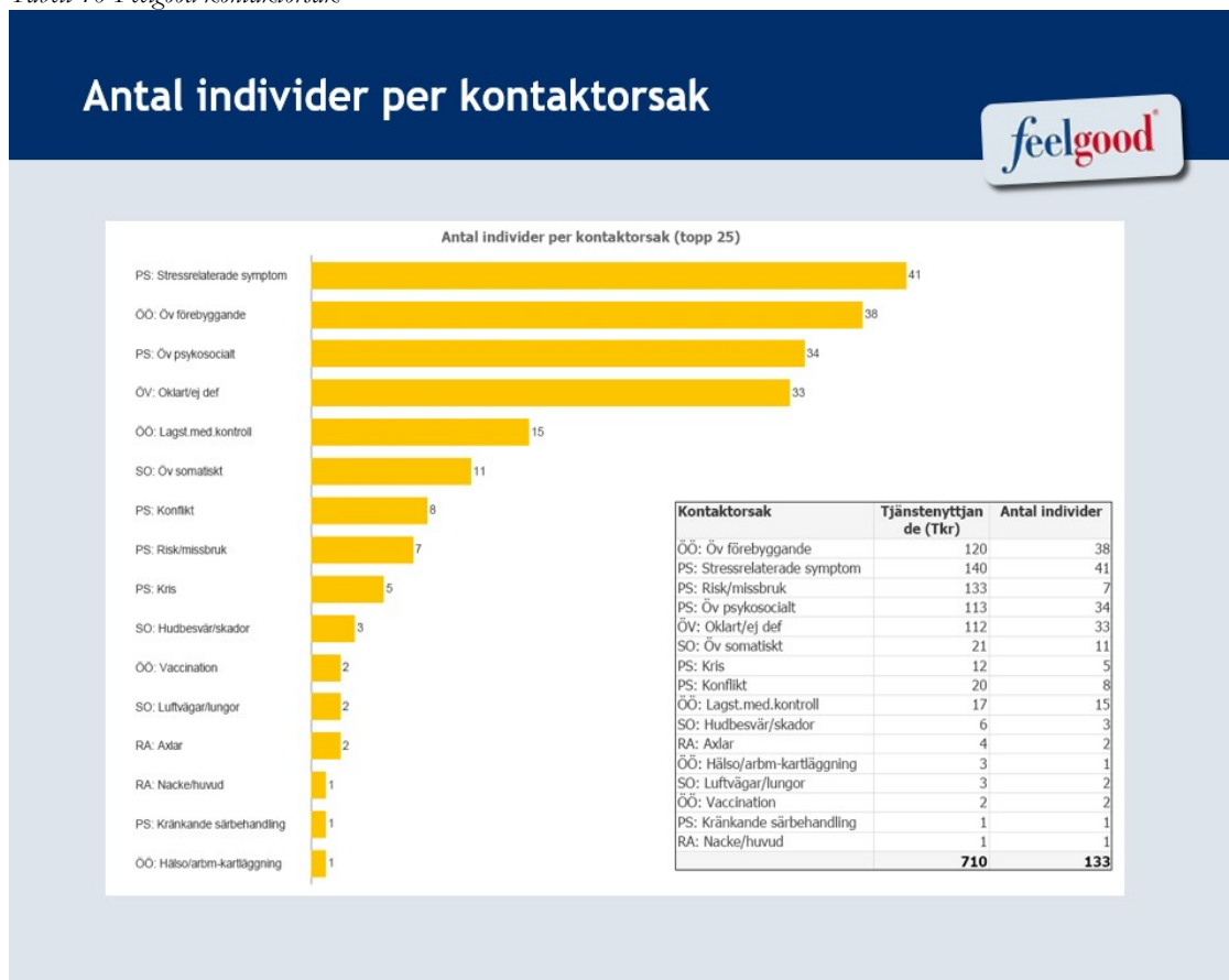
Tabell 10 Feelgood kontaktorsak