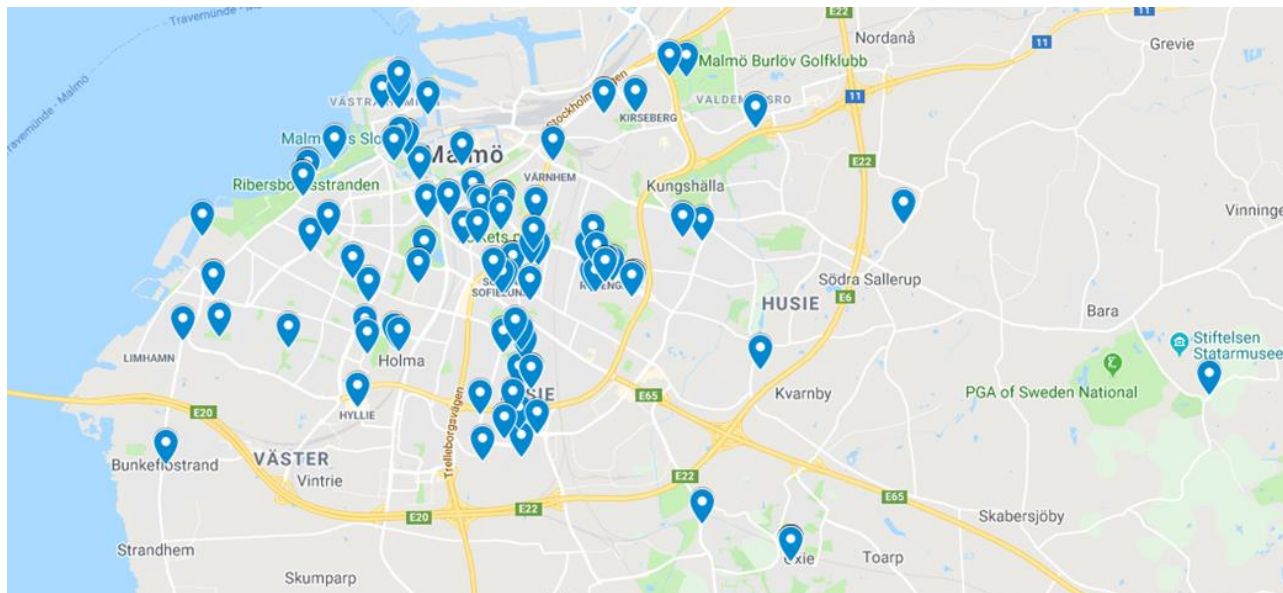
Bild 2. Kartöversikt över geografisk spridning av aktiviteter under sommarlovet