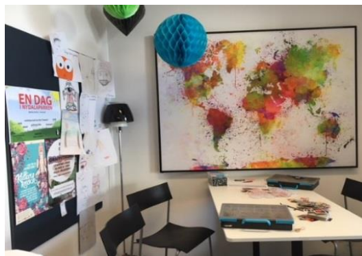
Ung fritid V*ästra hamnen