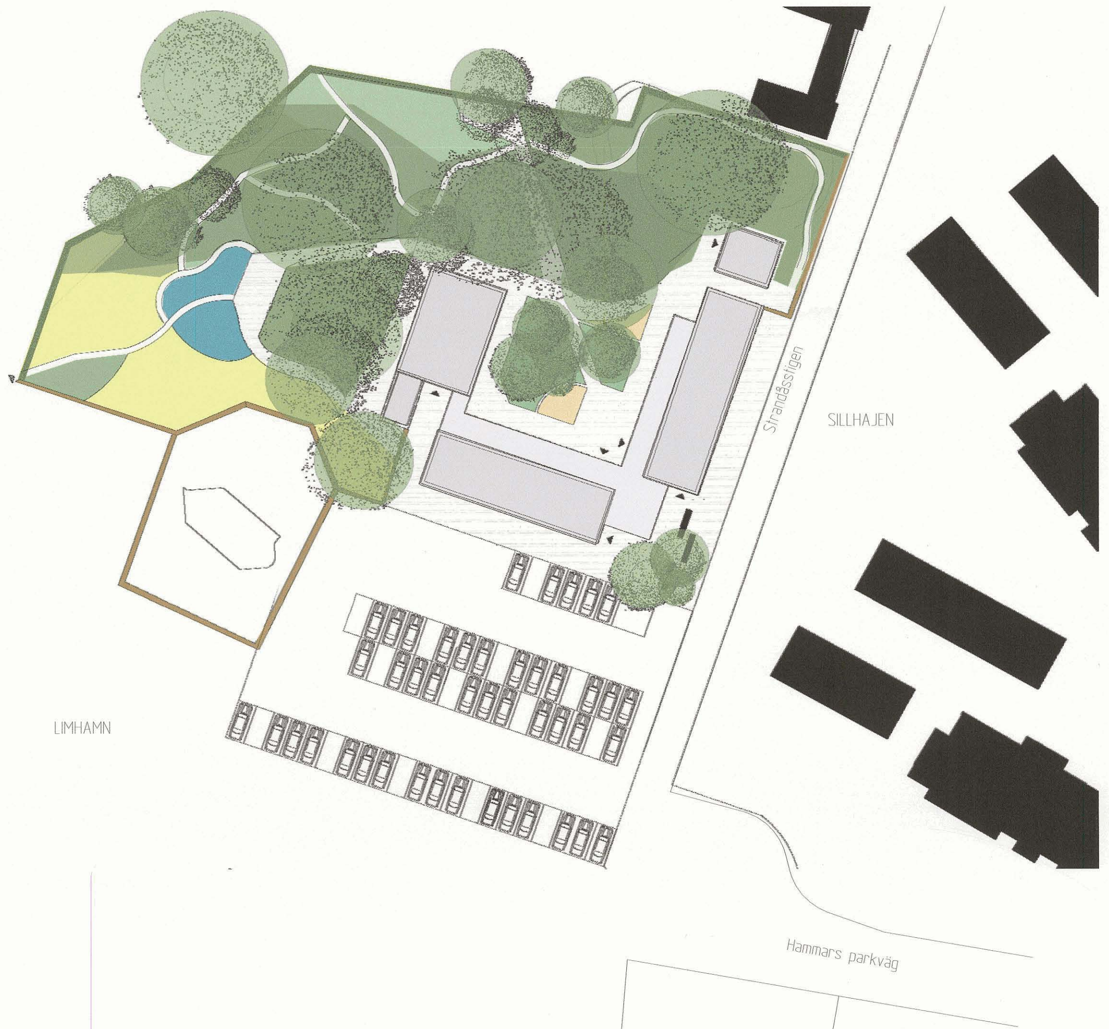
Illustration ritad av Arkitekt Carita Jönsson och Landskapsarkitekt Anna Magnusson, Stadsfastigheter