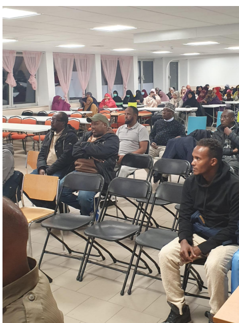
Föreläsning om Polisiära arbete inom området Rosengård. Många vårdnadshavare/medlemmar var riktigt intresserad till denna föreläsning.