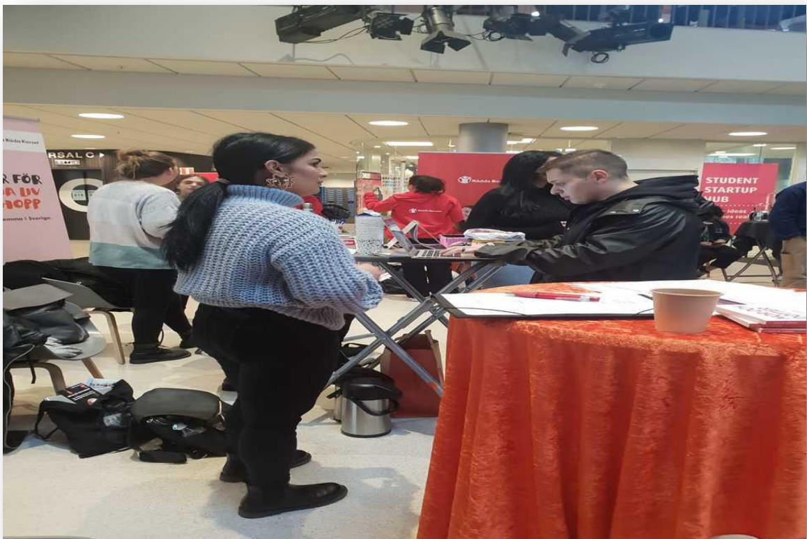
Malmö's föreningsmässas av Malmö Stad