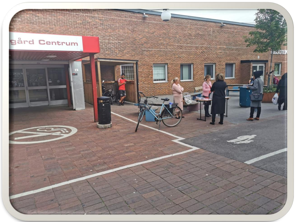
Utdelning av flyers (covid-19)