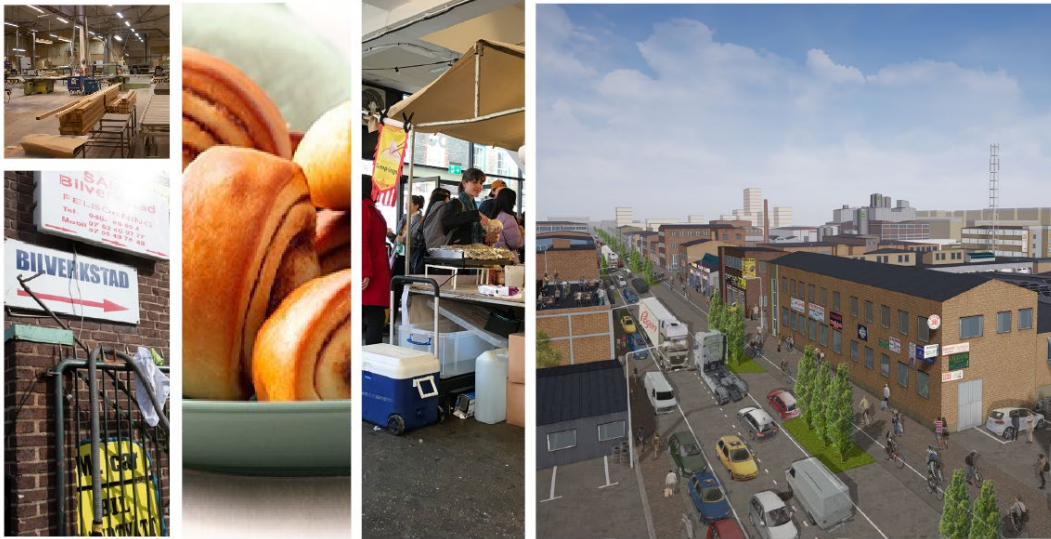
Norra Grängesbergsgatan sett mot norr.