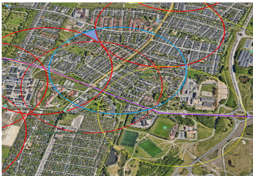
Figur 2. Cirklar symboliserar hållplatsernas upptagningsområden

Inom den blå cirkeln runt hållplats Broddastigen finns område (blåmarkerat) som inte täcks upp av annan hållplats inom 400 m. Området är litet och har goda gång- och cykelvägar inom 600 meter till hållplats Grönbetet. Området innehåller uteslutande villor och radhus där något längre gångavstånd är acceptabla. Områdena söder om Annetorpsvägen som Broddastigen täcker in försörjs bättre genom hållplats Elinelund.