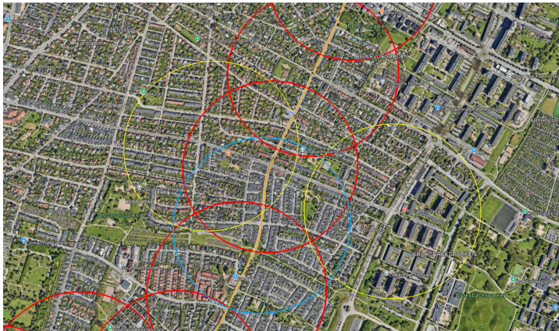
Figur 3. Cirklar symboliserar hållplatsernas upptagningsområden

Inom den blå cirkeln runt hållplats Bågängsvägen finns inget upptagningsområde som inte täcks upp av andra hållplatser. Cirklarna är 400 meter vilket medför att samtliga boende i området sannolikt har en hållplats inom 600 meter från någon av linjerna 1 eller 34.