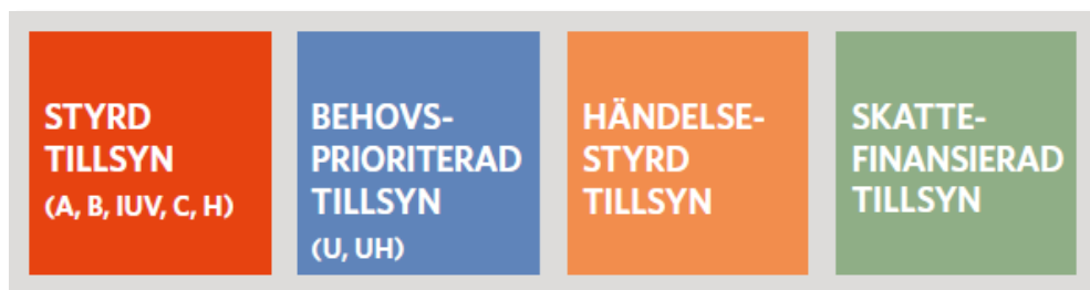
Figur 2 Tillsynskategorier inom miljö- och hälsoskyddstillsyn